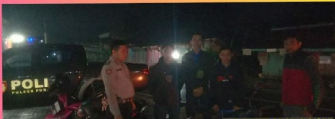
Situasi Kamtibmas Aman di Wilayah Hukum Polsek Purabaya Selama 1 x 12 Jam

Polsek Purabaya melaporkan situasi kamtibmas yang stabil dan aman di wilayah hukumnya selama periode 1 x 12 jam, dari pukul 20.00 WIB pada hari Senin, tanggal 25 Maret 2024 hingga pukul 08.00 WIB pada hari Selasa, tanggal 26 Maret 2024. Dalam laporan yang disampaikan, tidak terdapat gangguan kamtibmas yang signifikan.